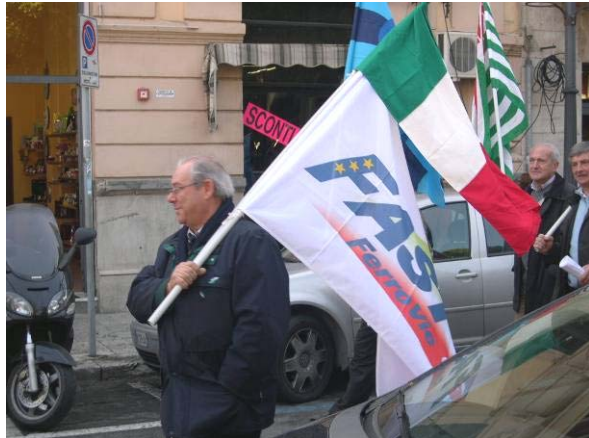
Foto - Alcuni momenti della manifestazione